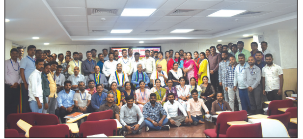
ಗಣ್ಯರೊಂದಿಗೆ ಸಂಯುಕ್ತ ಸಹಕಾರಿಯ ಸಿಬ್ಬಂದಿಗಳು